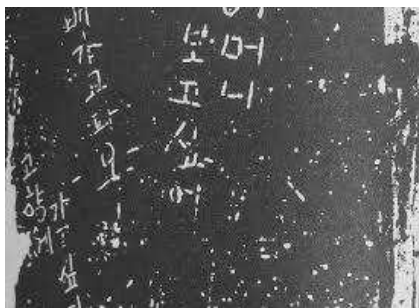
Theresa Cha's Dictée as a Montage

속 105, 2013). 언어는 역사와 민족 그리고 국가의 정체성과 연관되어 있다. 그것에는 정서적 공감대가 담겨있으며 발화되는 단순한 음소보다 더 많은 의미가 내포되어 있다. 이를 통해 언어는 개인의 정체성을 결정짓는 요소로써 작용한다. 따라서 언어를 잃거나 잇는다는 것은 자신의 목소리를 잃는 것이며 역사를 잃는 것이고 정체성을 잃는 것이고 새로운 언어를 습득하는 과정은 강요된 폭력이 될 수 있다. 차학경은 여러 형태의 미디어와 언어 및 역사적인 자료를 통합한 1982년의 『딕테』라는 작품에서도 시간과 기억의 문제와 더불어 언어의 문제에 집중한다. 모국어가 아닌 “낯선 언어를 배워야 하는 사람은 그 언어의 지배적인 힘으로 인해 자신의 무력감을 체험하게 된다”(김지하 90). 이 지배적인 힘을 견디기 위해 먼저 해야 하는 일은 받아쓰기를 통한 규칙의 습득이다.